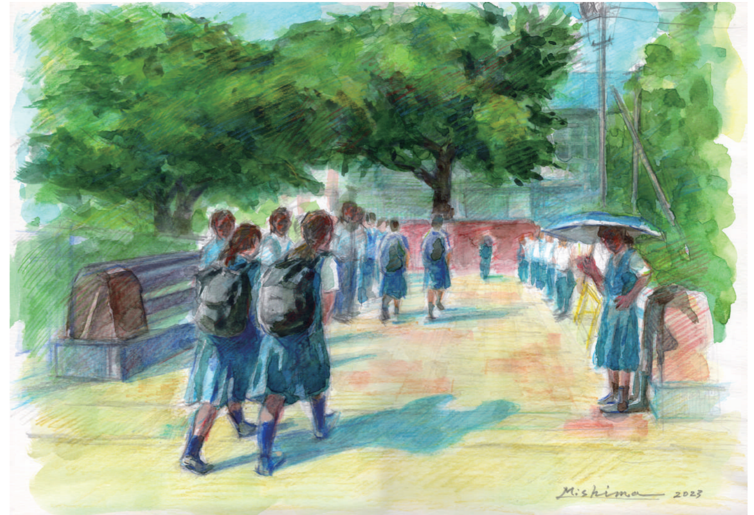
絵・美術科 未至磨 明弘 作