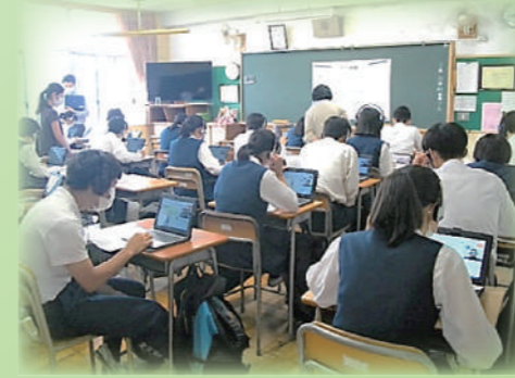
<オンライン英会話>